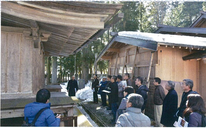
国指定重要文化財「荒城神社本殿」

同会では特別会員に「ちよつ と知らない」高山の魅力・再発 見をテーマに、年2回の市内視 察を開催しています。今回で5 回目となりました。