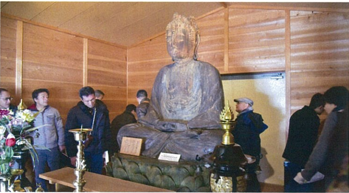
県指定重要文化財「木曾垣内大仏」