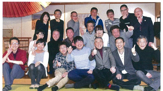
飛驒とらふぐに大満足の一行(八光苑)